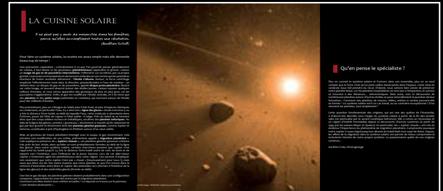
4 panneaux de format 125 cm x 250 cm

L'exposition est constituée de vingt-cinq panneaux imprimés sur polyester (195 microns) de trois tailles différentes.